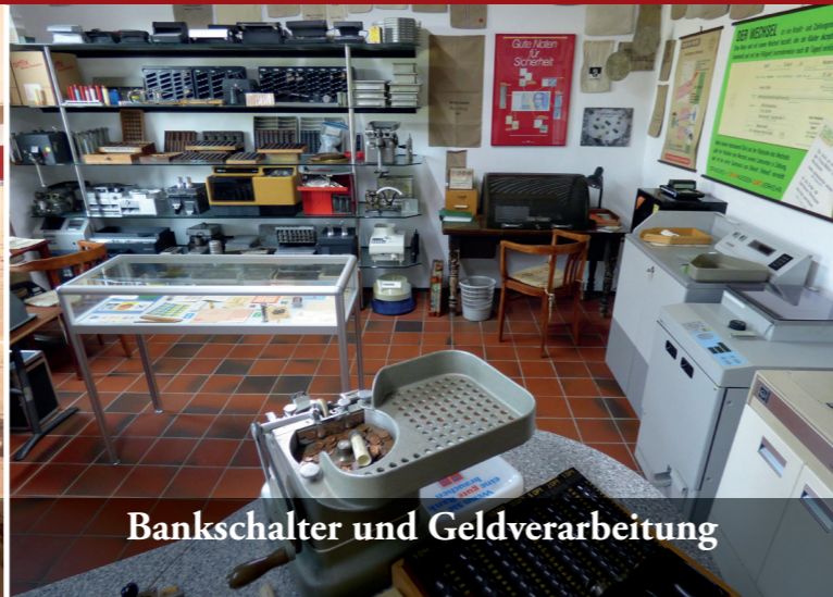
Bankschalter und Geldverarbeitung