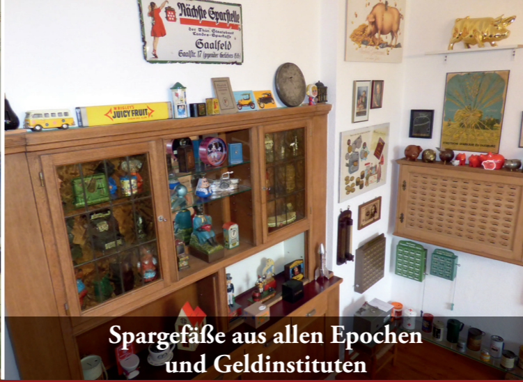
Spargefäße aus allen Epochen und Geldinstituten