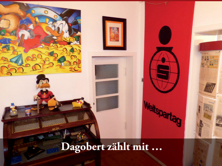
Dagobert zählt mit ...

Geldsack Strandgeld Schattenmark Xantener Denar Bitcoin Wechsel Kanonengeld Hyperinflation Sparschwein Notgeld Geldtransportwagen Sparefroh Penunzen Soldkasse Heiermann Rollierautomat Käschnote Carepaket Knochengeld Wardter Inselbrott(h)aler Operation Doorknob Kassenschalter Geldwaage Tigerzungengeld Schulsparen Sparclub Regionalgeld Spargroschen Weltpartag Kaurischnecke Konklave in Rothwesten Pecunia Non Olet