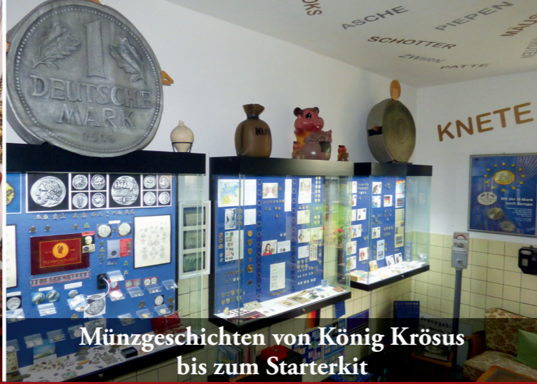
Münzgeschichten von König Krösus bis zum Starterkit